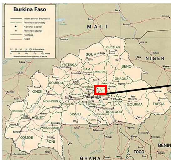
Figure 2, localisation de la commune de Zitenga, source : ambaburkinafaso-ch.org

La commune de Zitenga a connu plusieurs étapes dans son évolution administrative .Depuis l'adoption du code général des collectivités territoriales en 2004 Zitenga devint commune rurale et compte 45 villages.